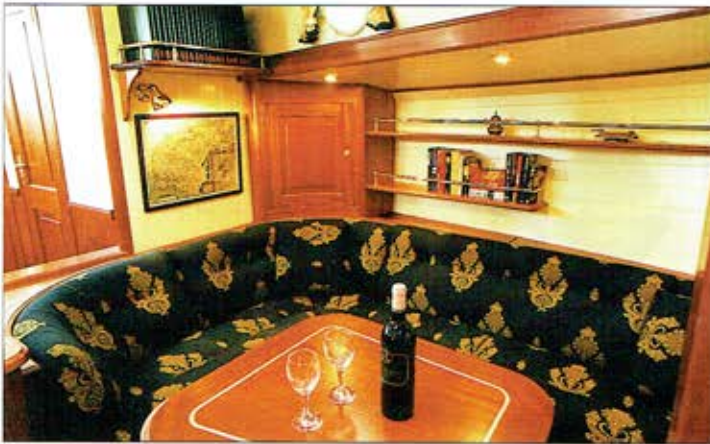
Foto 6. Voor het (extra) waterdichte schot bevindt zich achter het

ruimte. Op zee kunnen slingerlijsten geplaatst worden. Door deze configuratie is de kombuis extra groot zonder veel plaats van het interieur in te nemen.